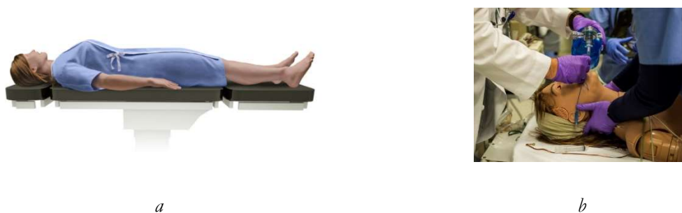
Figura 1. Modelo fisiológico integrado Athena (Medical Simulator®) (a), ejemplo de maniobra empleando a Athena (b)

El CSA cuenta con tres salas de simulación avanzada que reproducen una habitación de hospital, una sala UCI y un quirófano, con sus respectivos centros de control anexos. De momento, está equipado con un simulador de alta fidelidad, el cual simula un paciente femenino y corresponde al modelo Athena de Medical Simulator® (véase la figura 1). Asimismo, el Centro cuenta con la solución Learning-Space que permite realizar el Debriefing completo del entrenamiento. Esto último es muy interesante ya que podemos dividir a los alumnos en grupos reducidos (6-8 personas) realizando la actividad con el paciente “simulado” y a su vez el resto de alumnos lo están visualizando en tiempo real en la sala debriefing, así como analizando las constantes vitales, órdenes de los instructores mientras el profesor puede ir comentando a la clase cómo se debería proceder en cada maniobra o situación clínica.